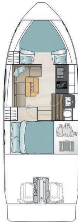
LOWER DECK standard