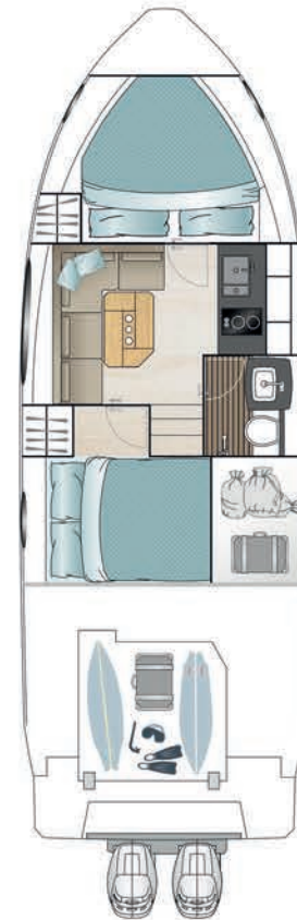
LOWER DECK option