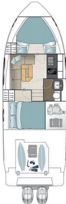
LOWER DECK option